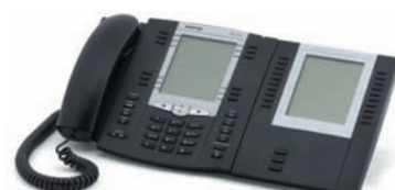
Aastra 6757i et son module M675i